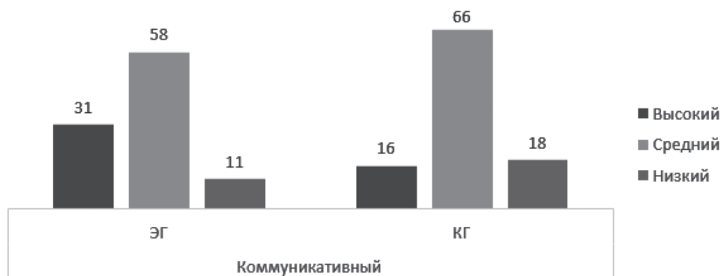
Рис. 5. Результаты определения уровня готовности по коммуникативному критерию в экспериментальной и контрольной группах