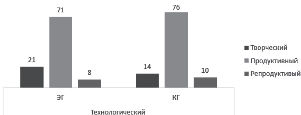
Рис. 3. Результаты определения уровня готовности по технологическому критерию в экспериментальной и контрольной группах Fig. 3. The results of determining the level of readiness in the experimental and control groups according to the technological criterion

По организационному критерию количество студентов с творческим уровнем готовности в экспериментальной группе на 13 % превысило количество таких студентов в контрольной, причем в контрольной группе количество студентов с творческим уровнем готовности составило только 10 %. Одновременно с этим в экспериментальной группе на 25 % меньше