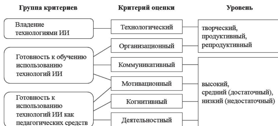
Рис. 1. Компоненты готовности бакалавра — будущего учителя информатики к применению технологий ИИ Fig. 1. Components of readiness of a bachelor, a future informatics teacher, for the use of AI technologies

нению технологий ИИ проводилась в 2018–2021 годах на базе ФГБОУ ВО «Новосибирский государственный педагогический университет» (НГПУ) и включала в себя четыре этапа: подготовительный, констатирующий, формирующий и контрольно-обобщающий.