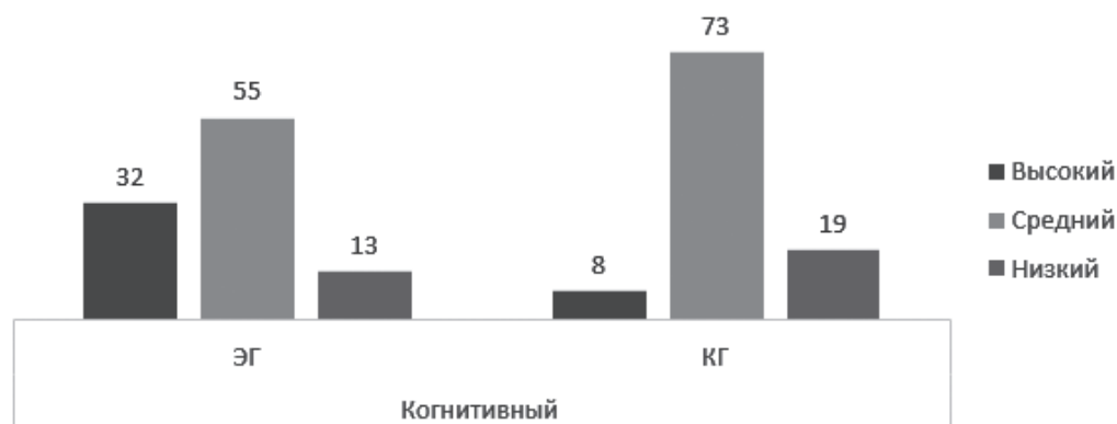
Рис. 8. Результаты определения уровня готовности по когнитивному критерию в экспериментальной и контрольной группах Fig. 8. The results of determining the level of readiness in the experimental and control groups according to the cognitive criterion

По когнитивному критерию количество студентов с высоким уровнем готовности в экспериментальной группе на 24 % превысило количество таких студентов в контрольной. При этом в экспериментальной группе на 6 % меньше студентов, показавших низкий уровень готовности по данному критерию, чем в контрольной. В контрольной группе студентов с низким уровнем готовности оказалось 19 % (рис. 8).