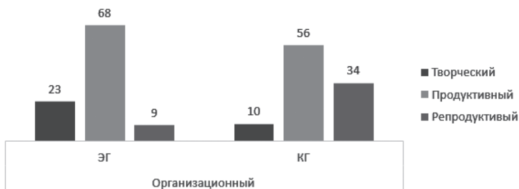
Рис. 4. Результаты определения уровня готовности по организационному критерию в экспериментальной и контрольной группах Fig. 4. The results of determining the level of readiness in the experimental and control groups according to the organizational criterion

По коммуникативному критерию количество студентов с высоким уровнем готовности в экспериментальной группе составило 31 % против 16 % в контрольной. В то же время количество студентов с низким уровнем готовности по данному критерию