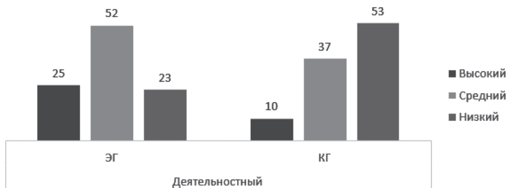
Рис. 9. Результаты определения уровня готовности по деятельностному критерию в экспериментальной и контрольной группах Fig. 9. The results of determining the level of readiness in the experimental and control groups according to the activity criterion

Результаты внедрения курса «Технологии искусственного интеллекта», разработанного с учетом предложенных организационно-педагогических условий, показали, что он позволил продемонстрировать обучающимся связи ИИ с другими науками и сферами человеческой деятельности; актуализировать изучение востребованного языка программирования Python 3; вызвать интерес и повысить внутреннюю мотивацию будущих учителей информатики к изучению технологий ИИ и их применению в профессиональной педагогической деятельности, в частности с помощью активного использования аудиовизуального технического обеспечения для повышения визуализации изучаемых методов и процессов, усиления их зрелищности; создать условия для реализации индивидуального подхода к каждому обучающемуся через обеспечение возможности формирования индивидуальных образовательных траекторий и применение метода учебной беседы; вовлечь обучающихся в процесс активной поисковой и творческой деятельности с использованием проблемно-поисковых и эвристических методов. Вы-