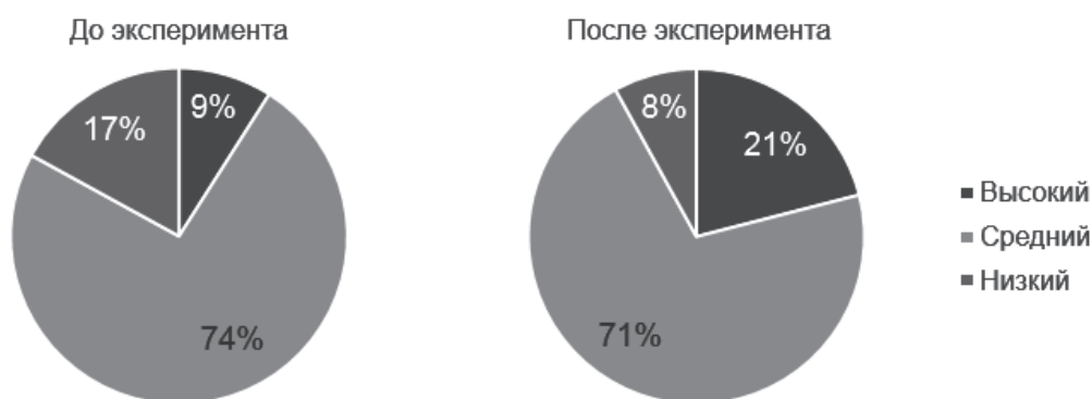
Рис. 6. Количество студентов в экспериментальной группе по обобщенным уровням мотивации

Стоит отметить, что в процессе эксперимента обучающиеся экспериментальной группы неоднократно указывали на то, что наибольший интерес у них вызывают учебные задания, предполагающие использование аудиовизуальных средств реализации технологий ИИ, особенно веб-камер, в лабораторно-практических работах по компьютерному зрению. Вероятно, именно по этой причине большая часть обучающихся экспериментальной группы (83 %) при разработке собственного творческого задания (конспекта урока) выбирали тему «Компьютерное зрение» с обязательным использованием веб-камеры. Остальные 17 % обучающихся разрабатывали задания по распознаванию и синтезу речи с использованием микрофонов и звуковоспроизводящих устройств. На наш взгляд, возможность применения аудиовизуальных средств при выполнении лабораторно-практических работ оказала существенное положительное влияние на освоение обучающимися экспериментальной группы технологий ИИ, что отразилось на более высоких результатах по организационному и мотивационному критериям по сравнению с контрольной группой.