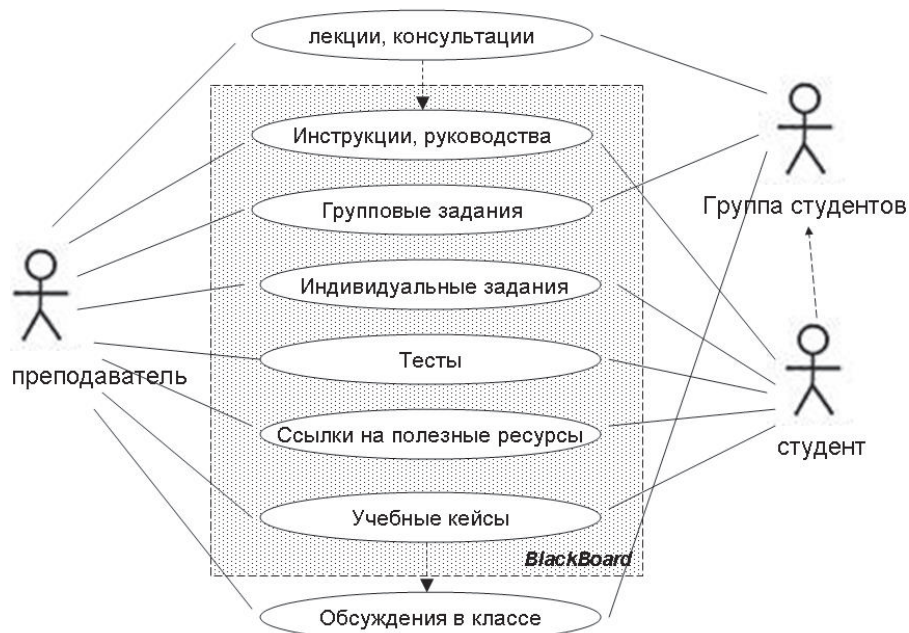
Рис. 1. Схема взаимодействия участников образовательного процесса через систему BlackBoard

Студенты изучают HRM-системы как инструмент работы менеджера, при этом демонстрируется возможность использования и оценки этих инструментов. При выборе изучаемых информационных систем учитывалось современное состояние HRM-систем, их рейтинг в мире и в России. Выбор основан на материалах отчета компании Forrester Research о HRM-системах, содержащего классификацию систем в зависимости от включенной в них функциональности, и обзора TAdviser [3] о наиболее популярных