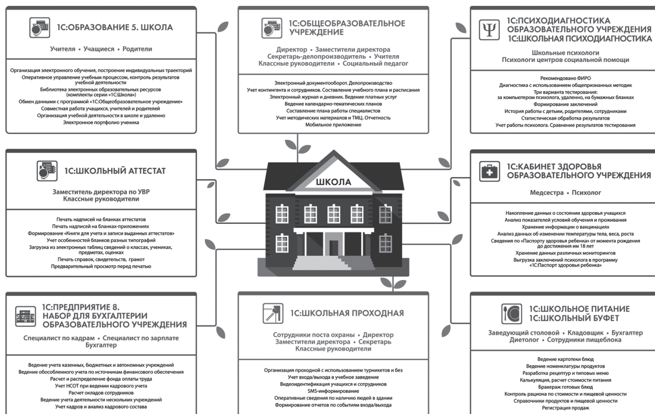
Рис. 4. Комплекс решений фирмы «1С» для учреждений образования