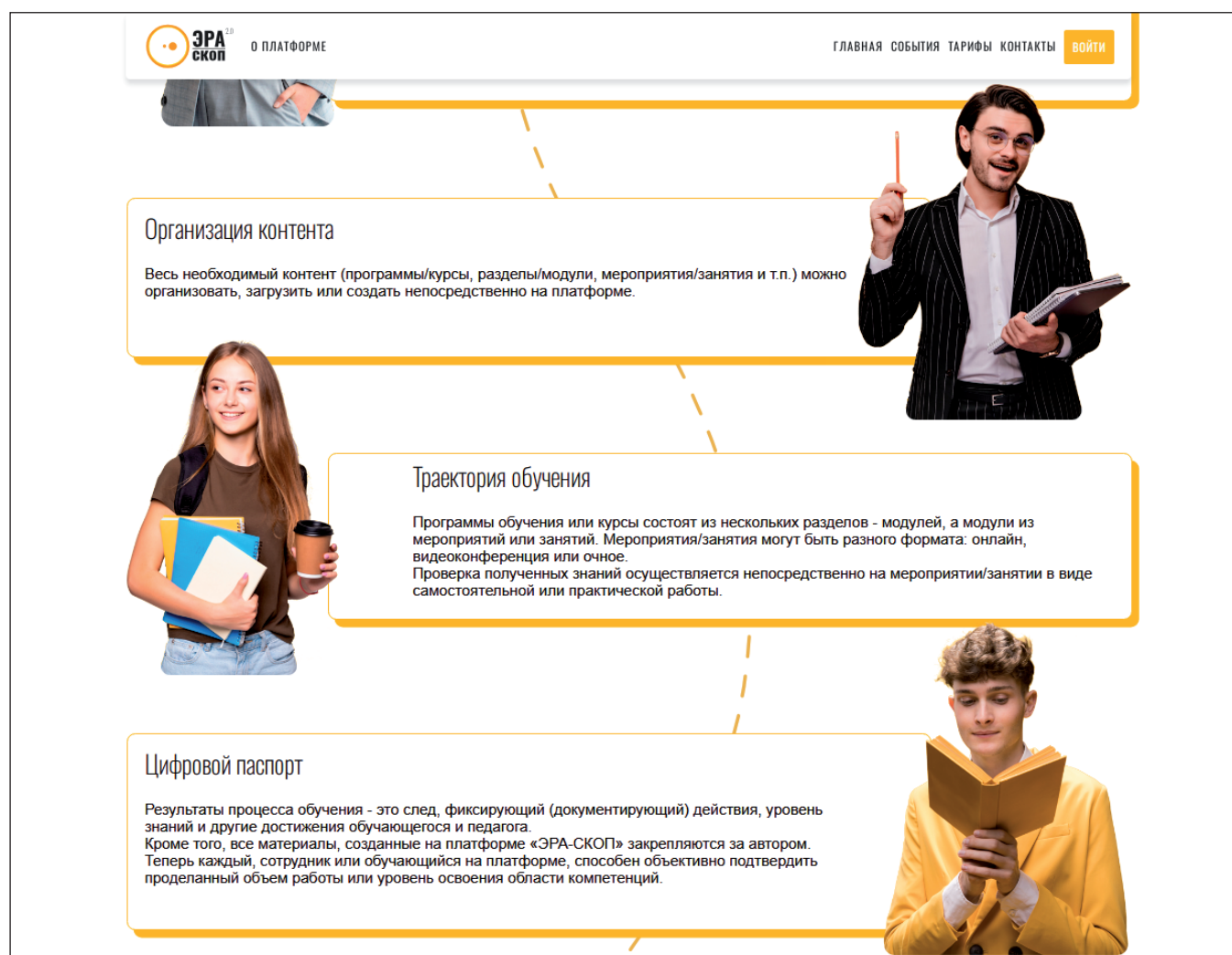
Рис. 1. Интеграционная платформа управления образовательным процессом «ЭРА-СКОП»

Результатом проведенных теоретических и эмпирических исследований стал цифровой ресурс «Центр наставничества» в системе постдипломного сопровождения и закрепления в профессии молодых педагогов, который является составной частью ИПУОП «ЭРА-СКОП» (рис. 1) и предоставляет инструменты для проведения наставнической образовательной де-