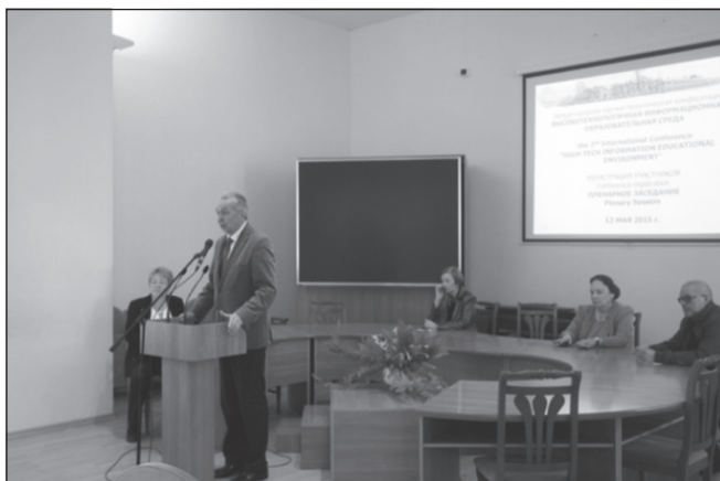
Фото. Выступление председателя оргкомитета конференции, академика РАО, вице-президента РАО В. В. Лаптева

Открыл пленарное заседание доклад председателя организационного комитета конференции, вице-президента Российской академии образования, академика РАО В. В. Лаптева [6]. В своем выступлении (см. фото) он отметил, что активная, нарастающая информатизация деятельности человека и требования, выдвигаемые инновационной экономикой к современному специалисту, предопределяют неизбежный переход не только к новым приемам работы со знаковыми системами, к принципиально иным интеллектуальным способам решения профессиональных задач, формам представления и извлечения знаний, но также к многовариантным коммуникациям в расширенных пространственных и временных координатах с использованием человеко-машинного взаимодействия и автоматизации рутинных операций. Поиск подходов к решению этой проблемы связан с осознанием того факта, что информатизация общества выводит ранее не востребованные аспекты профессиональной деятельности на лидирующие позиции, что, в свою очередь, влечет пересмотр устаревших образовательных стратегий.